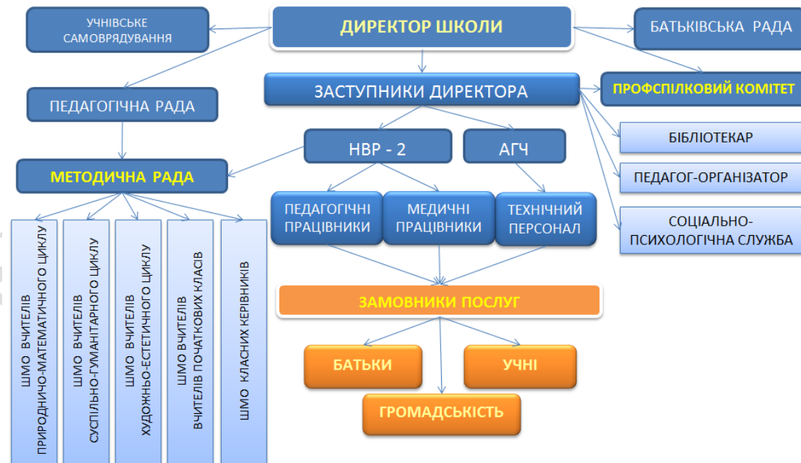
Схема управління закладом освіти: